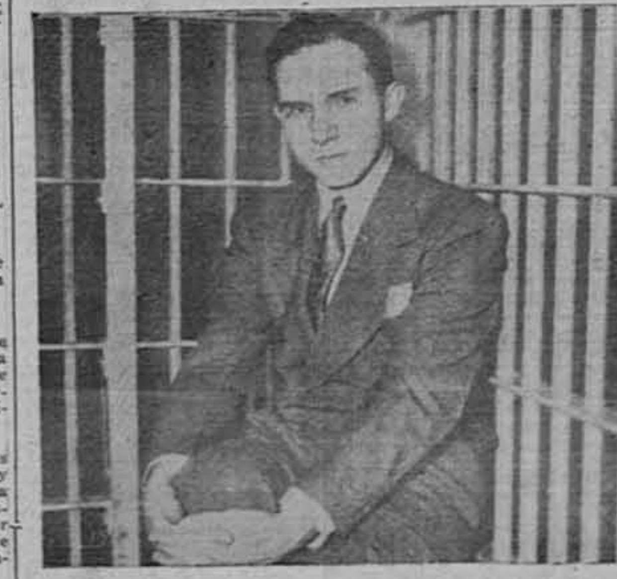
En la celda que ocupa en estos momentos, pensando en la silla eléctrica, Bruno Richard Hauptmann, fue capturado por la cámara de un repórter de la Prensa Asociada. Obsérvese su expresión de serenidad y cansancio.